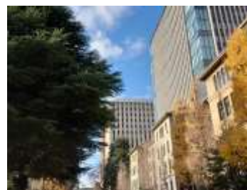
2025年12月19日 1. 3号館（椎名）