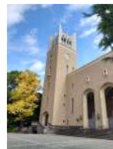
2025年11月18日 大隈講堂（椎名）

卒業後も様々な場面、方法で、これだけ母校を熱く応援できる。これぞ早稲田の強みだなあと感じました。